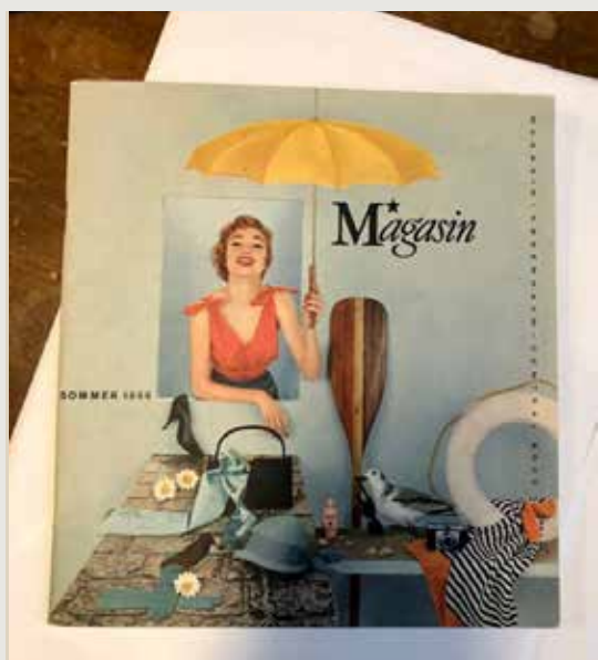
Magasin sommer katalog 1956 Nu med teak & hvidlakeret stålstel - og armlæn i teak