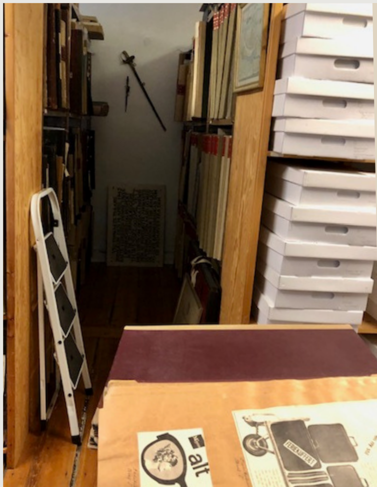
Tak til Magasin's arkiv & venlige hjælp

Stolen har udviklet sig over årene. Udgiven vist i 1962 er grundstenen i vores re-design