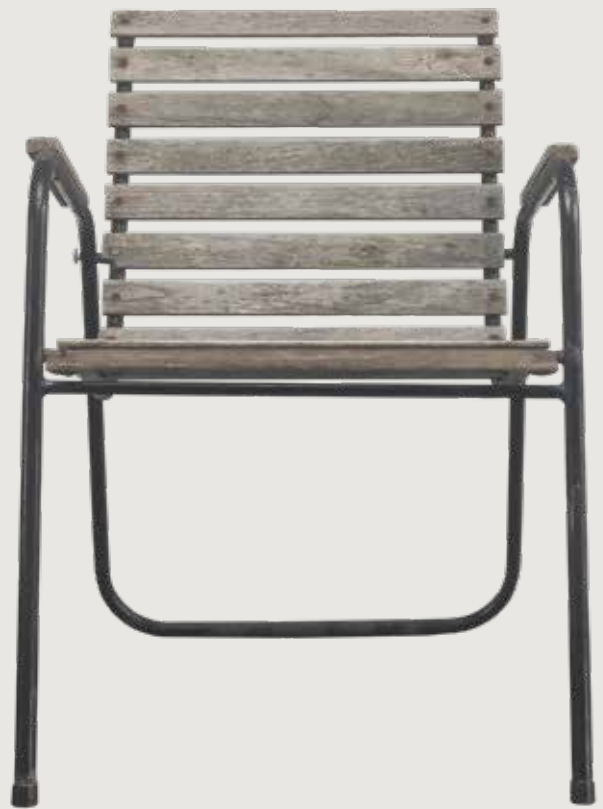
Stolen vi har modtaget - den er grundlaget for vores re-design

Stolen vi har fået fra vores kunde er vist i Magasin Du Nords annonce fra 1962.