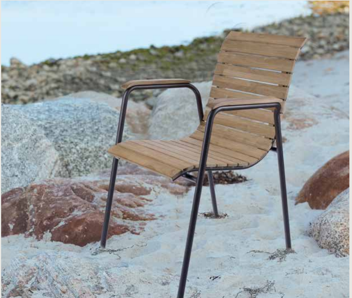
Bellevue 2023 - sidste twist er et nyt specialdesignet armlæn